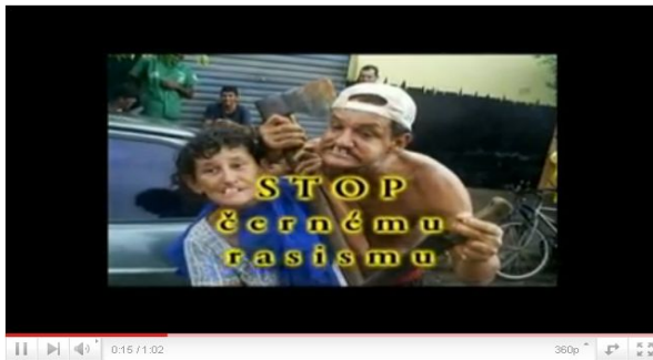
"Stop black racism" - campaign material from the Czech National Party