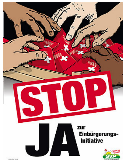
"Yes" to the immigration law (Switzerland)