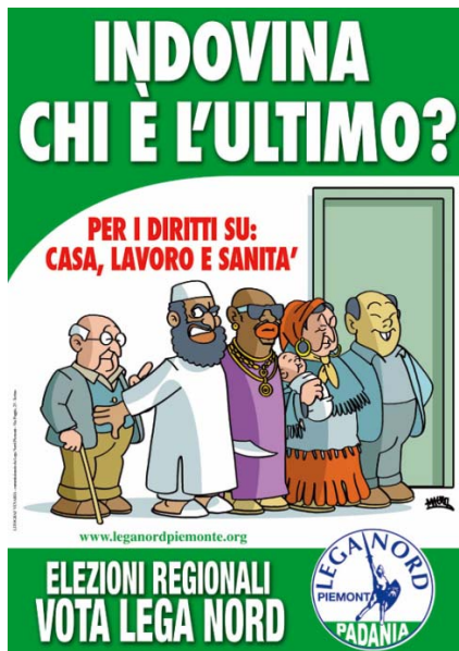
Don't want to be last? Priorities for housing, jobs and healthcare. Campaign material from the Italian Northern League