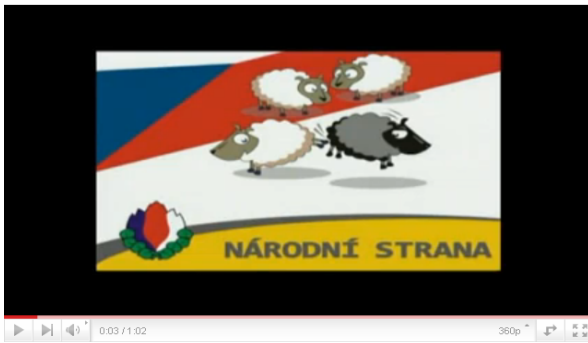
National Party, Czech Republic