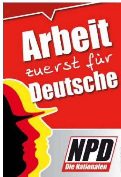
Jobs for the Germans first – Campaign material from the German National Democratic Party (NPD)