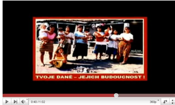
"The Future," campaign material from the Czech National Party